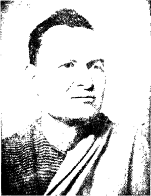
स्वर्गीय महापण्डित राहुल सांकृत्यायन